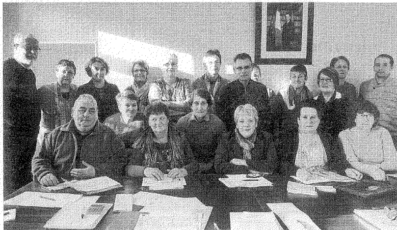
La réunion annuelle des chauffeurs bénévoles du service Solidarité Transport s'est déroulée vendredi matin à la mairie de Saint-Samson-de-Bonfossé en présence de la MSA, du SAG et de Familles Rurales.